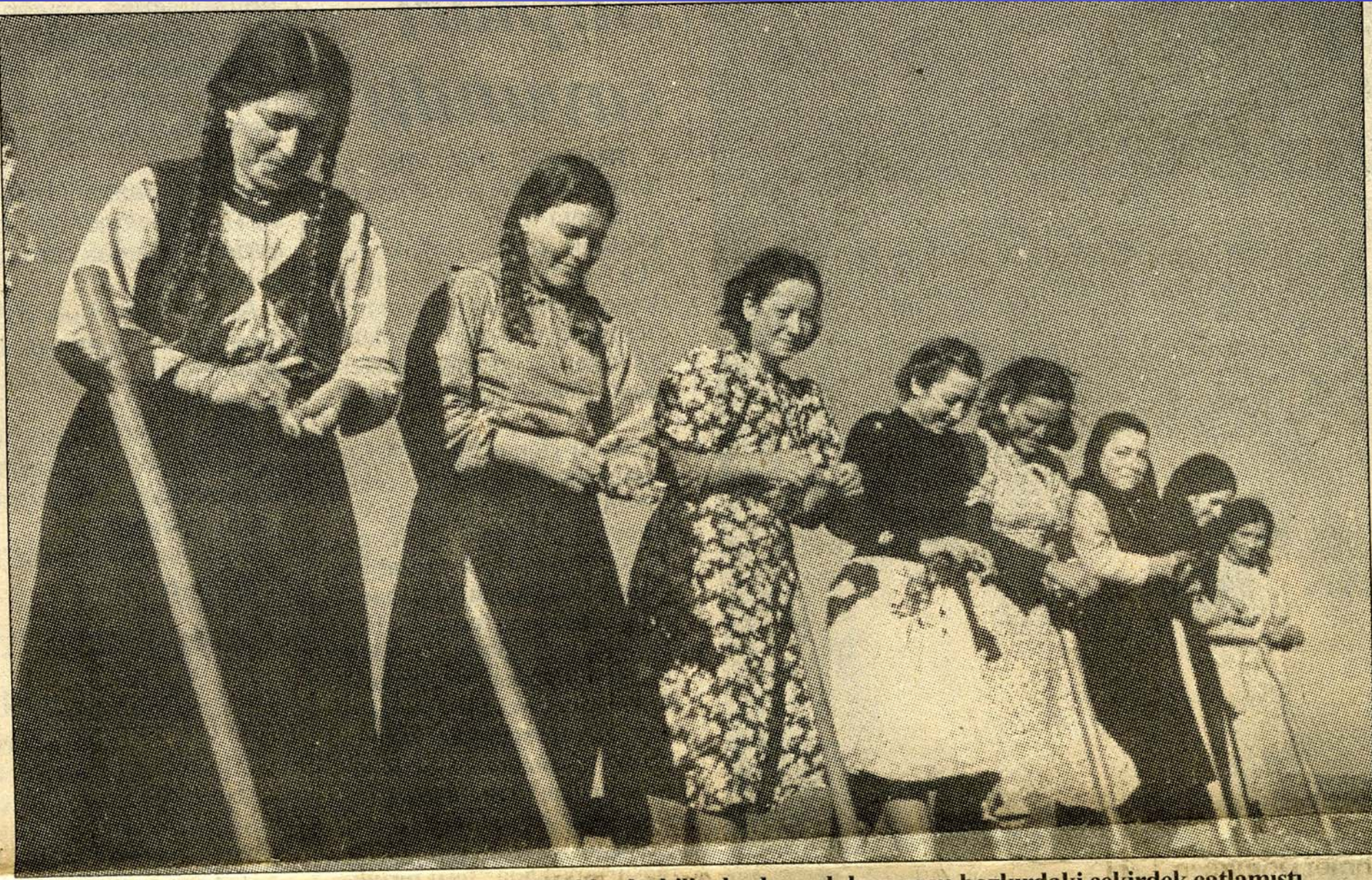
“Haydi Türkiye, haydi!” denmişti. Bu çağrı, yüreklerde, bilinçlerde yankılanmış ve bozkırdaki çekirdek çatlamıştı.