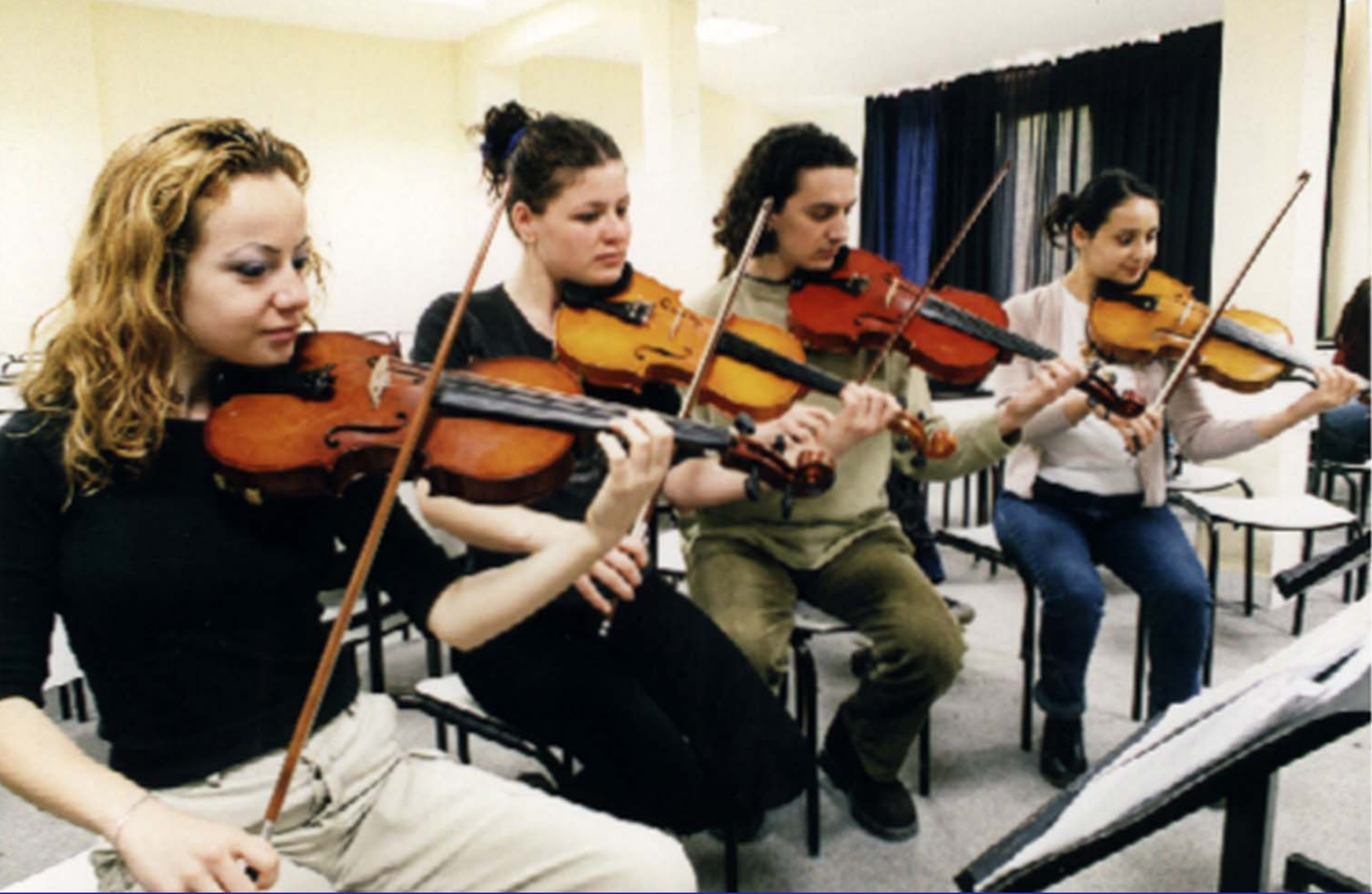
Marshall – Ömer İsmet Uzunyol Yerleşkesi