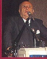
Süleyman Demirel 5.9.91