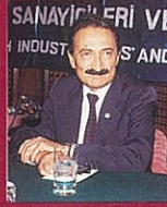
Bülent Ecevit 9.9.91