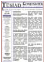
TÜSİAD Konjonktür Değerlendirme

2004 yılında yayınına ara veren TÜSİAD'ın "Görüş" dergisi, Seçim ve Siyasi Partiler Yasaları'nın değişmesi talebini dile getiren bir kapak konusuyla yeniden yayın hayatına başlamıştır. Görüş no. 61'in kapak konusu "Anayasa değişse de, siyaset değişmeyecek" şeklinde belirlenmiştir. Görüş'ün yıl içinde çıkan diğer sayılarında ise sırasıyla "Ekonomi: Resim herkes için aynı değil", "Sarkaç doğuya kayıyor: Türkiye sürüklüyor mu, sürükleniyor mu?", "Bize yeni bir Anayasa gerekli" ve "3. Dünya Savaşı ekonomide mi çıkacak?" başlıklı kapak konularını içermiştir.