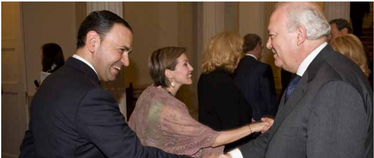
BUSINESSEUROPE Başkanlar Konseyi, Madrid, 10-11 Haziran 2010