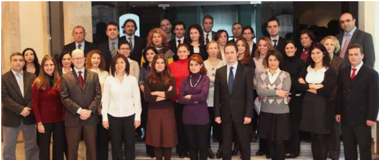
TÜSİAD Genel Sekreterliği kadrosu