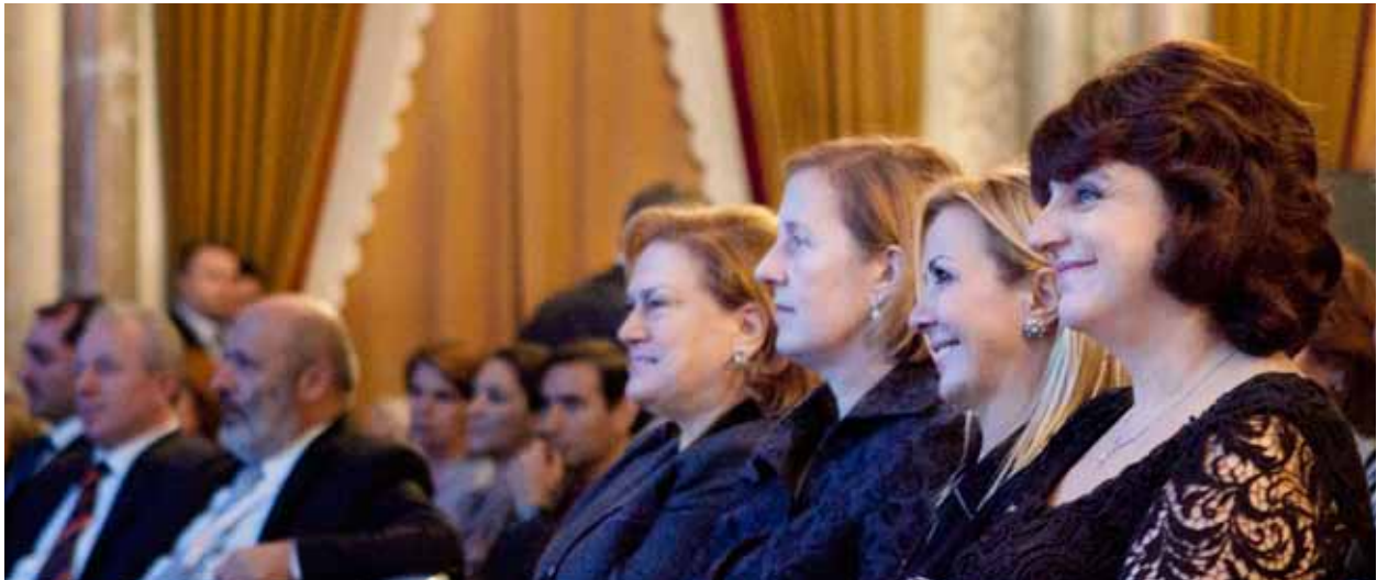
Sabancı Holding Yönetim Kurulu Başkanı Güler Sabancı, Devlet Bakanı Selma Aliye Kavaf, TÜSİAD Yönetim Kurulu Başkanı Ümit Boyner, TÜSİAD Kadın-Erkek Eşitliği Çalışma Grubu Başkanı Nur Ger, “Çalışma Hayatında Kadın Konferansı ve Kısa Film Gösterimi”, 14 Ocak 2011