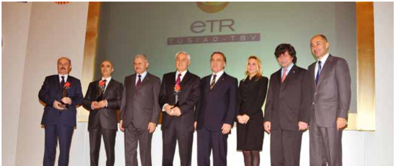
TBMM Başkanı Mehmet Ali Şahin ve Ulaştırma Bakanı Binali Yıldırım’ın katılımıyla, TÜSİAD-TBV 8. eTürkiye (eTR) Ödülleri Töreni, 20 Aralık 2010