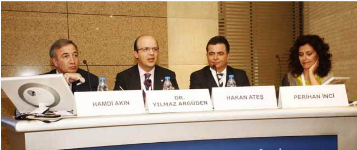
"Yönetim Kurulları İçin Kurumsal Yönetim Prensipleri" Tanıtım Semineri, 2 Temmuz 2010

Fikri Haklar Çalışma Grubu Kurumsal Yönetim Çalışma Grubu Perakende Sektörü ve Tüketici Hakları Çalışma Grubu Rekabet Çalışma Grubu Şirketler Hukuku Çalışma Grubu