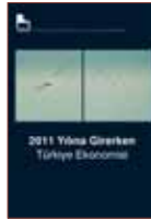
2011 Yılına Girerken Türkiye Ekonomisi

TÜSİAD Medya İlişkileri Bölümü tarafından aylık olarak hazırlanan yayın, TÜSİAD faaliyetleri ile ilgili özet bilgi sunmaktadır. Görsellerle renklendirilen TÜSİAD Manşet, toplantılar, yurtiçi ve yurtdışı temaslar ile TÜSİAD yönetim kurulu başkanı ve üyelerinin demeçlerini konu almaktadır.