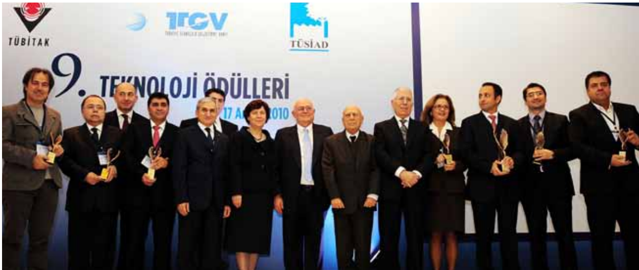
TÜBİTAK-TTGV-TÜSİAD 9. Teknoloji Ödülleri, 17 Aralık 2010