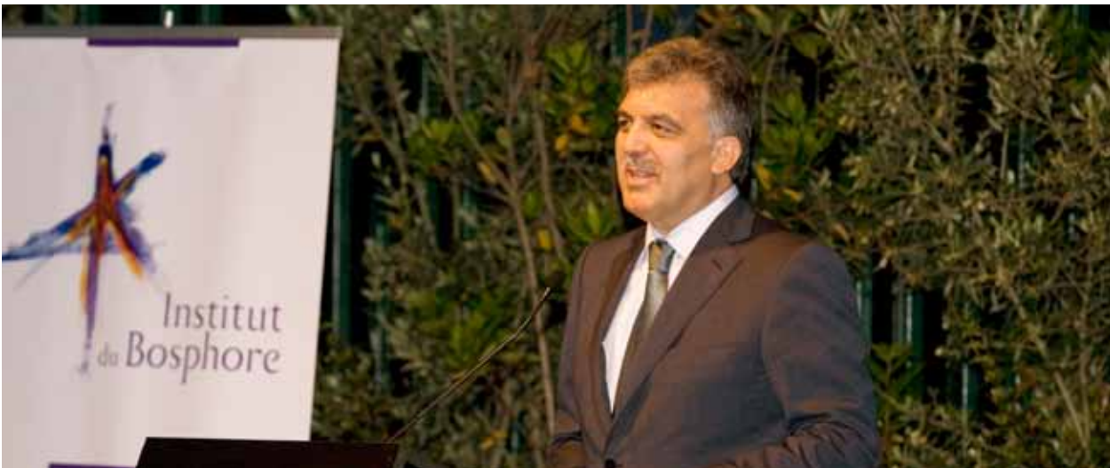
Cumhurbaşkanı Abdullah Gül, Institut du Bosphore "Türkiye ve Dünya: Yeni Oyuncular, Yeni Vizyon" semineri, 11-12 Haziran 2010