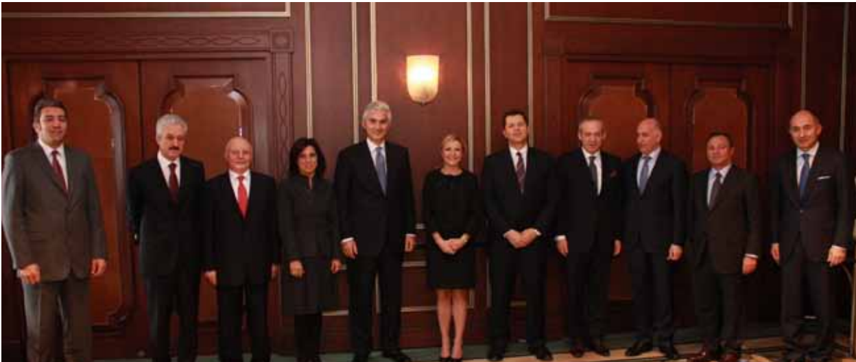
TÜSİAD Yönetim Kurulu