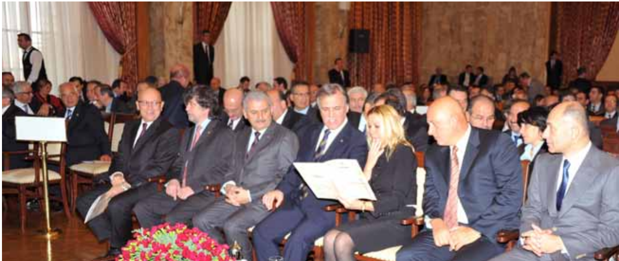
TBMM'de düzenlenen 8. Türkiye (eTR) Ödülleri Töreni, 20 Aralık 2010