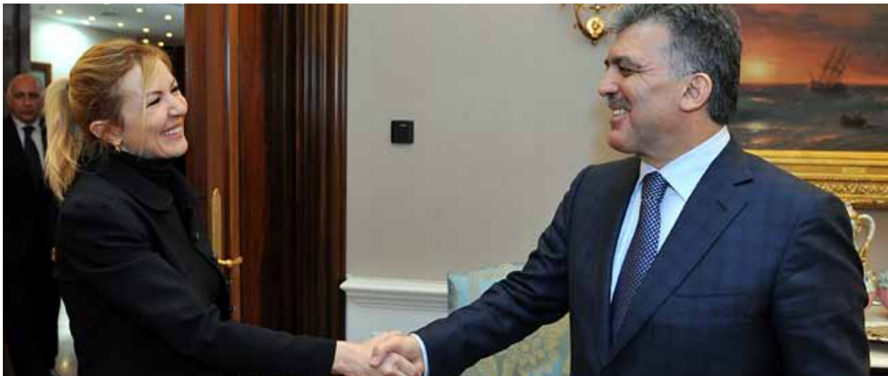
TÜSİAD Yönetim Kurulu’nun Cumhurbaşkanı Abdullah Gül’ü ziyareti, 24 Şubat 2010