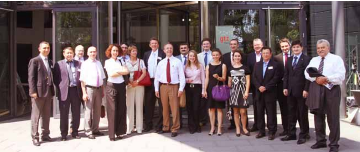
UBCCE'nin GTZ Eschborn, Almanya merkezine ziyareti, 24-25 Haziran 2010