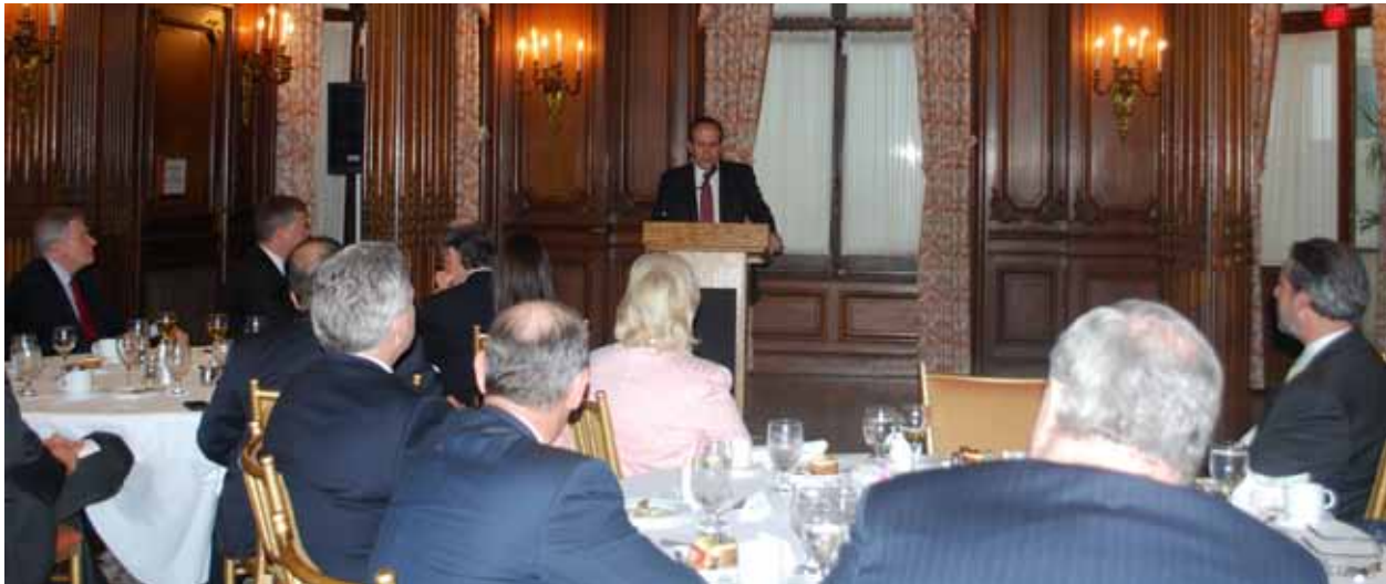
T.C. Washington Büyükelçisi Namık Tan ile konferans, 9 Haziran 2010

Türkiye ve ABD arasındaki ekonomik ilişkilerin canlandırılması fikrinin içinin doldurulması amacıyla 2010 yılında TÜSİAD International bünyesinde oluşturulan ABD Çalışma Grubu’nun birlikte çalışacağı ve programlar gerçekleştireceği muhatap kuruluşları tespit amacıyla 2010 yılı boyunca çeşitli Amerikan iş dünyası örgütleriyle temaslara devam edilmiştir. Bu kapsamda Amerikan Ticaret Odası (US Chamber of Commerce) bünyesinde aynı amaçla oluşturulan Türkiye Çalışma Grubuyla ortak çalışmalar yapılması ve projeler geliştirilmesi konusunda mutabakata varılmıştır. Ayrıca, TÜSİAD International ile birlikte ABD’ye yönelik olarak ne tür girişimlerde bulunulabileceği ve faaliyetler gerçekleştirileceği konularında birçok çalışma yapılmış ve toplantılar gerçekleştirilmiştir.