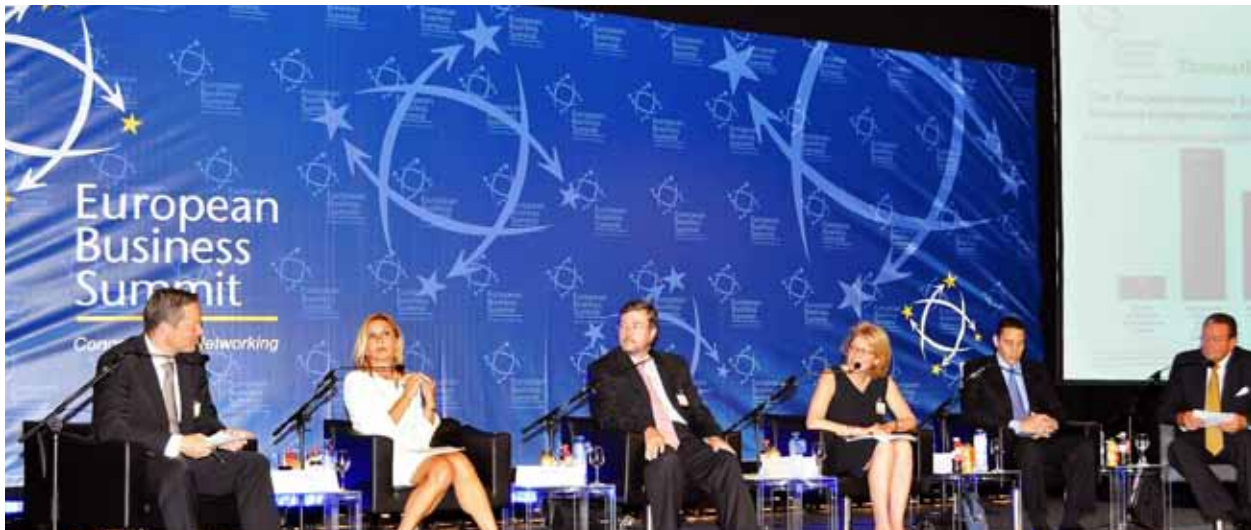
TÜSİAD Yönetim Kurulu Başkanı Ümit Boyner, 8. Avrupa İş Zirvesi (European Business Summit), 30 Haziran 2010

TÜSİAD, BUSINESSEUROPE üyesi olan İspanyol İşverenler Konfederasyonu (CEOE)'nu İspanya'nın AB dönem başkanlığında Madrid'de ziyaret etmiştir ( 21-22 Nisan 2010 ). Ziyarete CEOE Yönetim Kurulu üyeleriyle Avrupa