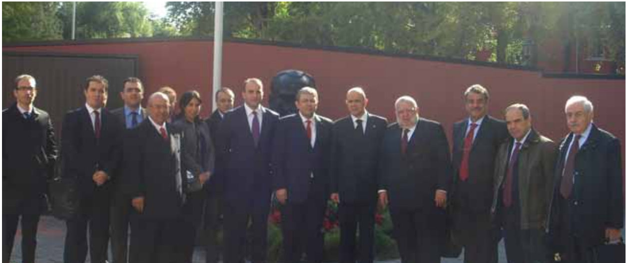
TÜSİAD International'ın T.C. Pekin Büyükelçiliği ziyareti, 26 Ekim 2010

KOBİ Çalışma Grubu faaliyetleri çerçevesinde yılın ilk yarısında düzenli olarak toplantılar gerçekleştirilmiş, Çin'deki yabancı KOBİ'lerin konumu, iş yaparken karşılaşılan zorluklar, KOBİ'lerle ilgili yeni yasa ve yönetmelikler ele alınmış ve AB Ticaret Odası'na üye şirketler arasında görüş alışverişi sağlanmıştır. Çin hükümetinin ilgili birimleri ve çeşitli KOBİ sektörel organizasyonlarıyla toplantılar gerçekleştirilmiştir. AB Ticaret Odası tarafından her yıl düzenli olarak yayınlanan "2010-2011 Görüş Belgesi'nin KOBİ Çalışma Grubu'nun "Çin'deki Yabancı KOBİ'ler ve İş Ortamı, Gelişmeler ve Öneriler" bölümü yazılmıştır. Avusturya Ticaret Odası ile birlikte "Çin'de Temsilcilik Ofisi açma ile uygulamaya konulan yeni yönetmelikler ve içeriği", Çin'deki Belçika ve Fransa Ticaret Odaları ile ortak "How to Prepare Your Company for the Next Step of Growth?" konulu seminerler; Çin-Amerika Ticaret Odası ile birlikte "networking" faaliyetleri gerçekleştirilmiştir.