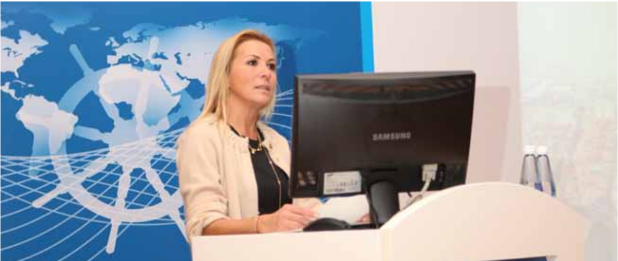
TÜSİAD Yönetim Kurulu Başkanı Ümit Boyner, Gemi İnşa Sanayi Konferansı, 12 Ekim 2010