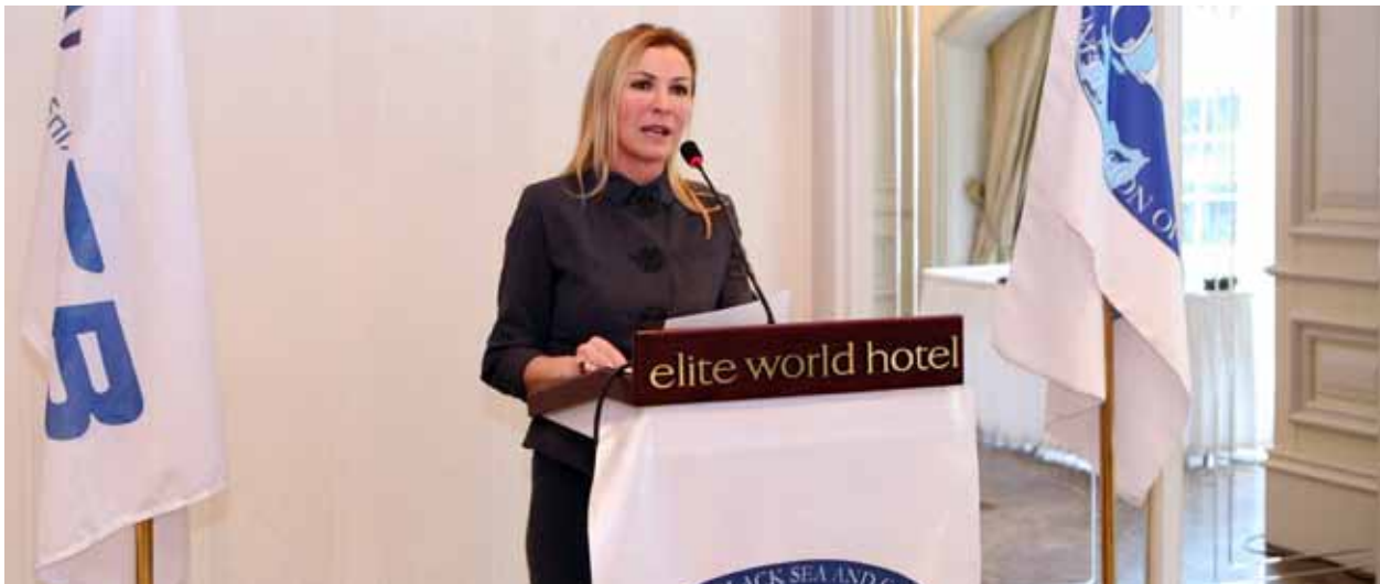
TÜSİAD Yönetim Kurulu Başkanı Ümit Boyner, UBCCE 3. Olağan Genel Kurul toplantısı, 12 Mart 2010

Çevreye duyarlı iş yapma şekillerinin giderek önem kazanması ve buna paralel olarak "yeşil" iş sahalarının dünyada hızla artan bir biçimde gelişim göstermeye başlaması, UBCCE'nin 2010 yılı faaliyetlerini bu alanda yoğunlaştırmasına neden olmuştur. Birliğin, Genel Kurulunda onaylanan "UBCCE için çevreci iş olanakları geliştirilmesine destek" projesinin eğitim amaçlı ilk toplantısı GTZ'nin Eschborn, Almanya'daki merkezinde gerçekleştirilmiştir ( 24-25 Haziran 2010 ). Söz konusu toplantıda, pilot ülkeler olarak seçilen Ukrayna ve Azerbaycan'a yönelik faaliyetler belirlenmiş ve bir çalışma takvimi oluşturulmuştur. Bu kapsamda ilki Donetsk, Ukrayna'da ( 7-8 Ekim 2010 ), ikincisi ise Bakü, Azerbaycan'da ( 13-14 Aralık 2010 ) olmak üzere iki çalıştay düzenlenmiş ve her iki ülkedeki iş dünyası örgütlerinin çevreye duyarlı iş yapma kapasitelerinin geliştirilmesine yönelik strateji dokümanları oluşturulması amacıyla çalışmalar başlatılmıştır. Projenin 2011 yılı Mayıs ayında sonuçlandırılması hedeflenmektedir.