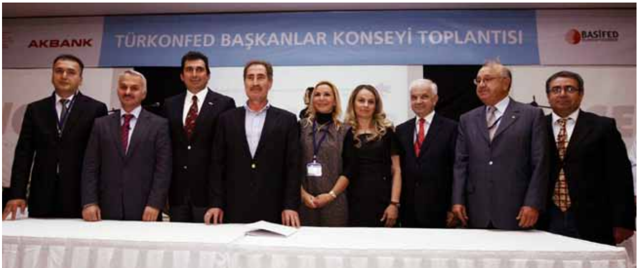
TÜRKONFED Başkanlar Konseyi, Bodrum, 7-8 Ekim 2010

TÜSİAD; yerel, bölgesel ve ulusal boyutta örgütlenmiş gönüllü mesleki-sosyal kuruluşların, bilinçli ve katılımcı bir toplumun oluşturulmasında öncülük üstlendiklerine olan inancı ile, bu kuruluşlarla daha yakın ve sürekli bir ilişki kurulması ve bölgeler arası gelişmişlik farklılıklarının azaltılmasını sağlayacak politikaların oluşturulması yönünde çalışmalar yapmaktadır. Ayrıca, sürdürülebilir büyüme ve yerel potansiyellerin büyüme sürecine etkili katılımı açısından önem arz eden bölgesel kalkınma politikaları ve faaliyetleri de Bölgesel Gelişme ve İş Dünyası ve Sivil Toplum Kuruluşları ile İlişkiler Komisyonu tarafından üstlenilmiştir.