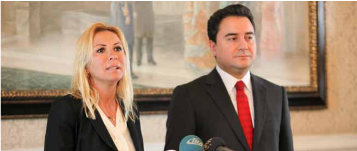
TÜSİAD Yönetim Kurulu Başkanı Ümit Boyner ve Devlet Bakanı ve Başbakan Yardımcısı Ali Babacan, Sanayi Politikaları Forumu, 6 Kasım 2010

Zirvenin sonucunda, iş dünyası temsilcilerinin çalışma grupları rapor sonuçlarından oluşan ortak bir deklarasyon yayınlamıştır. Özel sektör temsilcilerinden oluşan B20