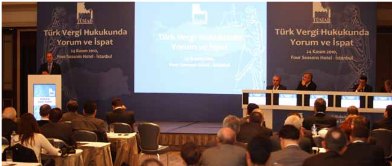
Türk Vergi Hukukunda Yorum ve İspat Paneli, 24 Kasım 2010