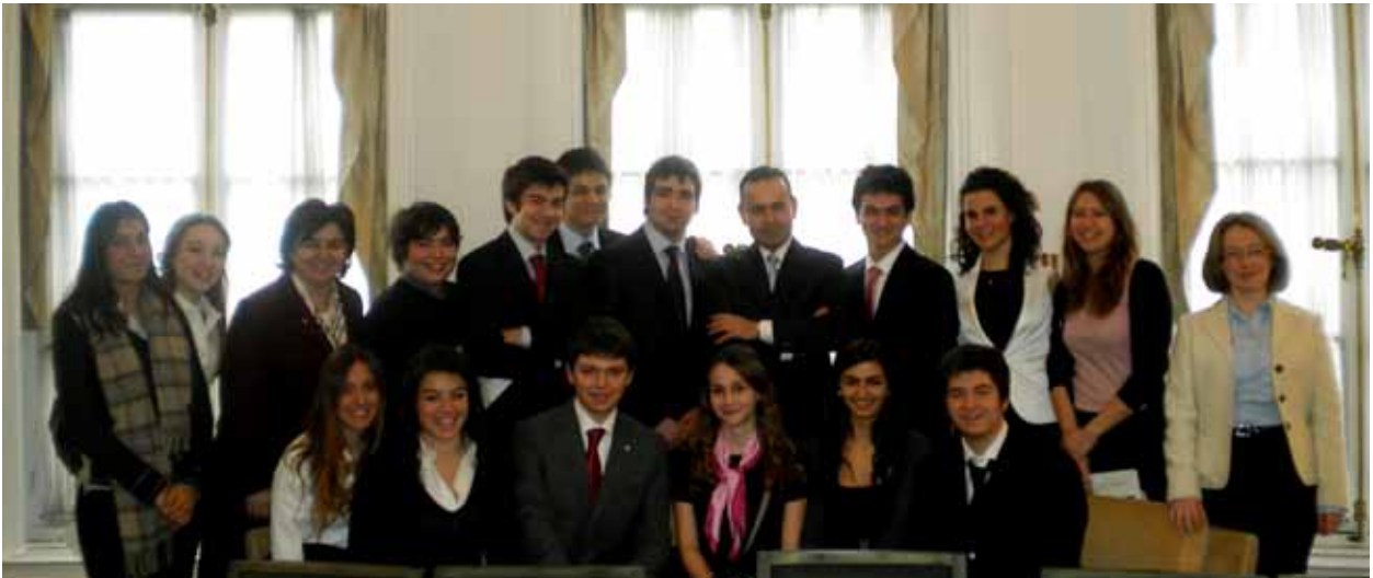
St. Benoit Lisesi öğrencilerinin TÜSİAD AB-Brüksel Temsilciliği'ni ziyareti