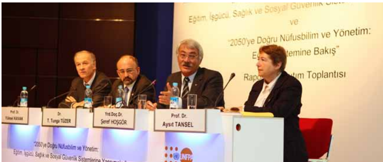
TÜSİAD-UNFPA "2050'ye Doğru Nüfusbilim ve Yönetim" raporları tanıtımı, 5 Kasım 2010