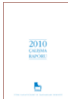
TÜSİAD 2010 Çalışma Raporu

TÜSİAD Ekonomik Araştırmalar Bölümü tarafından hazırlanan rapor, içinde bulunulan yıl ile ilgili Türkiye ve dünya ekonomisini değerlendirmekte ve gelecek yıl için TÜSİAD'ın temel ekonomik değişkenlere yönelik resmi tahminlerini içermektedir.