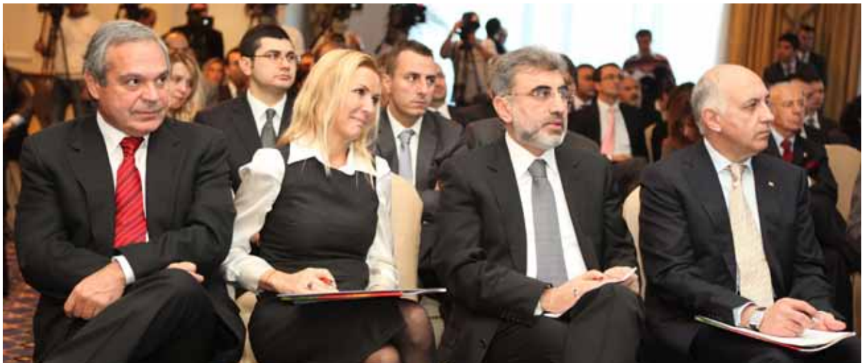
"World Energy Outlook 2010" Raporu Tanıtım Toplantısı, 24 Kasım 2010