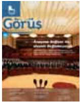
Görüş no. 61-65

2004 yılında yayınına ara veren TÜSİAD'ın "Görüş" dergisi, Seçim ve Siyasi Partiler Yasaları'nın değişmesi talebini dile getiren bir kapak konusuyla yeniden yayın hayatına başlamıştır. Görüş no. 61'in kapak konusu "Anayasa değişse de, siyaset değişmeyecek" şeklinde belirlenmiştir. Görüş'ün yıl içinde çıkan diğer sayılarında ise sırasıyla "Ekonomi: Resim herkes için aynı değil", "Sarkaç doğuya kayıyor: Türkiye sürüklüyor mu, sürükleniyor mu?", "Bize yeni bir Anayasa gerekli" ve "3. Dünya Savaşı ekonomide mi çıkacak?" başlıklı kapak konularını içermiştir.