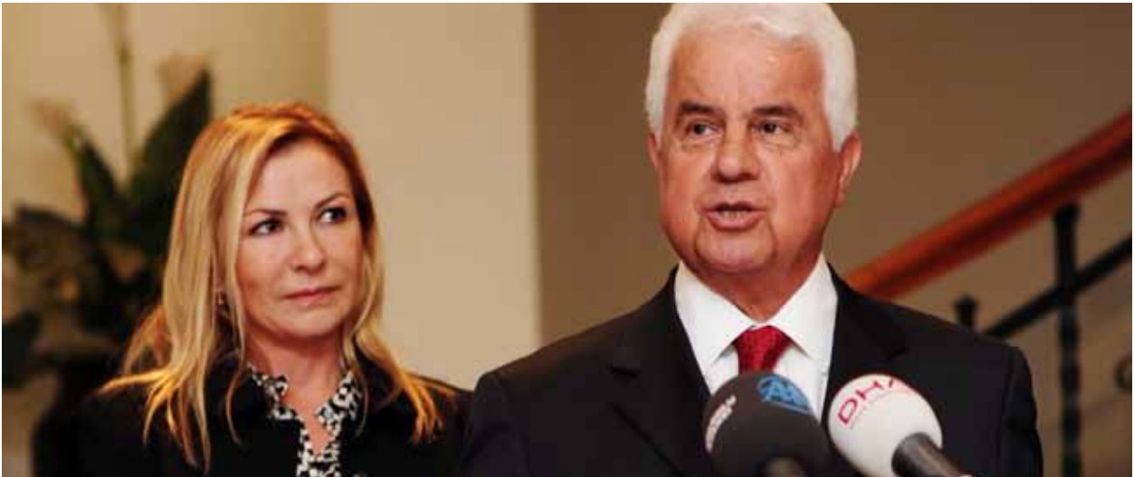
TÜSİAD Yönetim Kurulu Başkanı Ümit Boyner ve KKTC Başbakanı Derviş Eroğlu, 9 Mart 2010

Dışişleri ve AB Uyum Komisyonu'nun genel çalışma alanı TÜSİAD'ın küresel ve bölgesel örgütler ve muhatap işveren kuruluşlarıyla olan ilişkilerinin geliştirilmesi, TÜSİAD'ın Brüksel ve Washington, D.C. Temsilcilikleri,