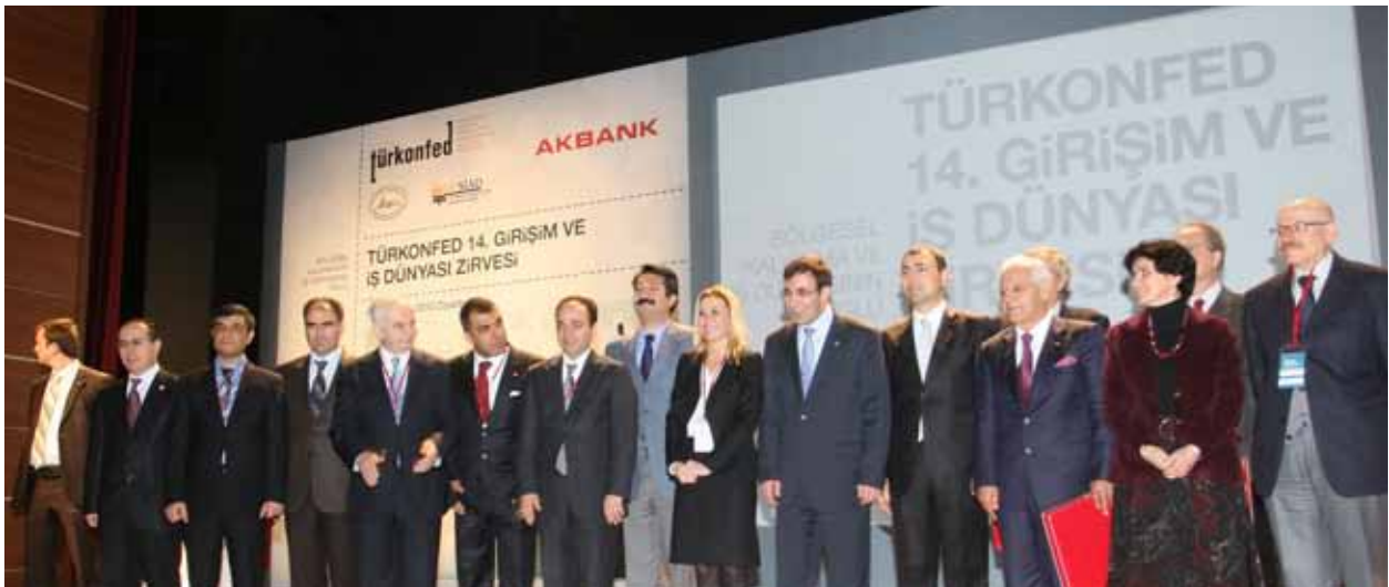
TÜRKONFED Girişim ve İş Dünyası Zirvesi, 17-18 Aralık 2010