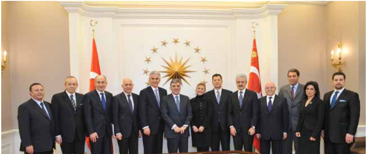
TÜSİAD Yönetim Kurulu'nun Cumhurbaşkanı Abdullah Gül'ü ziyareti, 24 Şubat 2010

Temsilcilik, 2010 yılında da AB müzakere süreci çalışmalarını yakından takip etmiştir. Başta TÜSİAD'ın ve genel olarak sivil toplumun müzakere sürecine zamanlı ve etkili katılımını temin etmek üzere, AB'ye uyum sürecinde karşılaşılabilecek zorluklar ve benimsenecek çalışma modelleri konularında kapsamlı temaslar sürdürülmüştür. AB müzakere sürecine ilişkin güncel gelişmeler aylık "Ankara Bülteni" aracılığıyla sunulmuştur.