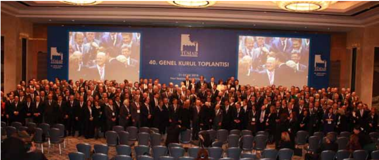
TÜSİAD 40. Genel Kurul Toplantısı, 21 Ocak 2010