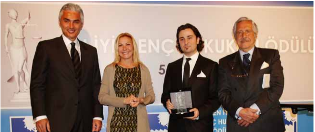
TÜSİAD En İyi Genç Hukukçu Ödülü Töreni, 5 Nisan 2010

Küçük Ölçekli Ürün Kategorisi: Baykar Makine San. ve Tic. A.Ş. (Bayraktar-Çaldıran Taktik İnsansız Hava Aracı Sistemi)