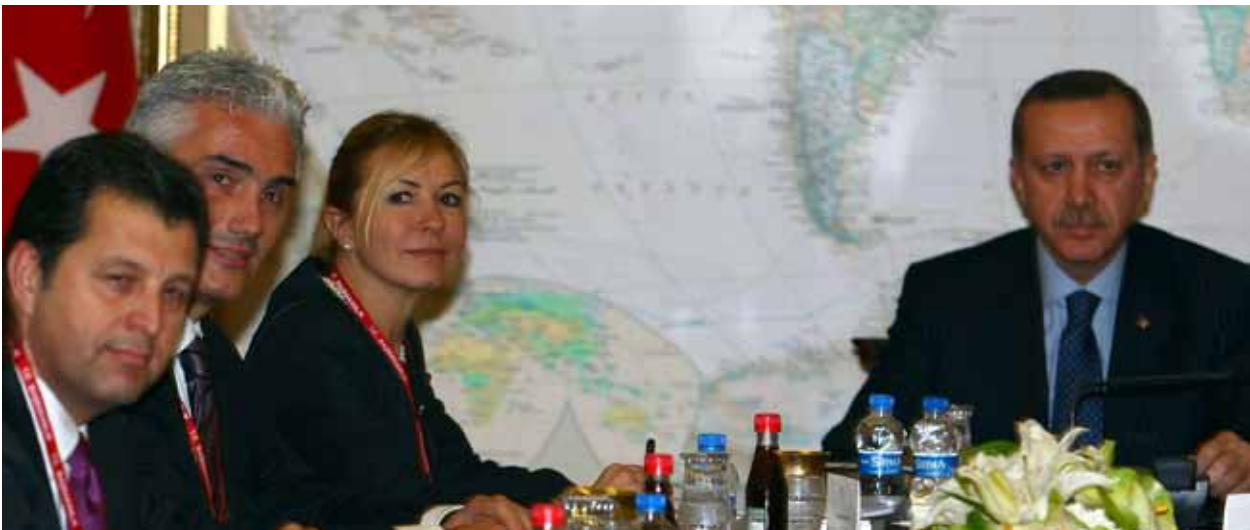
TÜSİAD Yönetim Kurulu'nun Başbakan Recep Tayyip Erdoğan'ı ziyareti, 18 Şubat 2010