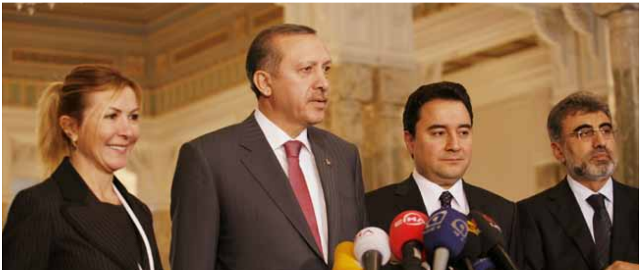
TÜSİAD Yönetim Kurulu Başkanı Ümit Boyner, Başbakan Recep Tayyip Erdoğan, Devlet Bakanı ve Başbakan Yardımcısı Ali Babacan, Enerji ve Tabii Kaynaklar Bakanı Taner Yıldız, Türkiye-Kore İş Forumu, 9-10 Mart 2010