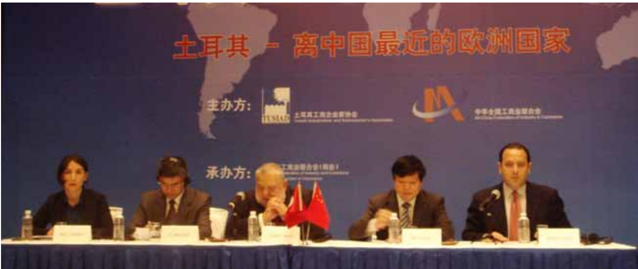
TÜSİAD International'ın Çin İş Geliştirme Ziyareti, 24-28 Ekim 2010