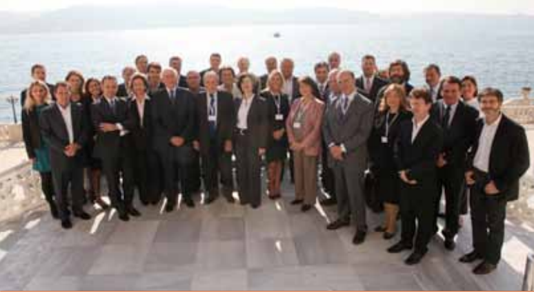
Türk-Fransız ilişkilerinin temel aktörlerinden biri

Institut du Bosphore Cercle Toplantısı, 19 Eylül 2012